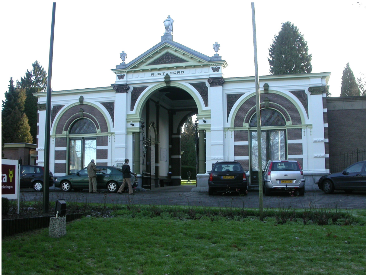
Poortgebouw van Begraafplaats Rustoord aan de Postweg 60 te Nijmegen. Deze begraafplaats werd opgericht door de Diaconie der Nederlandse Hervormde Gemeente en werd geopend in 1897.